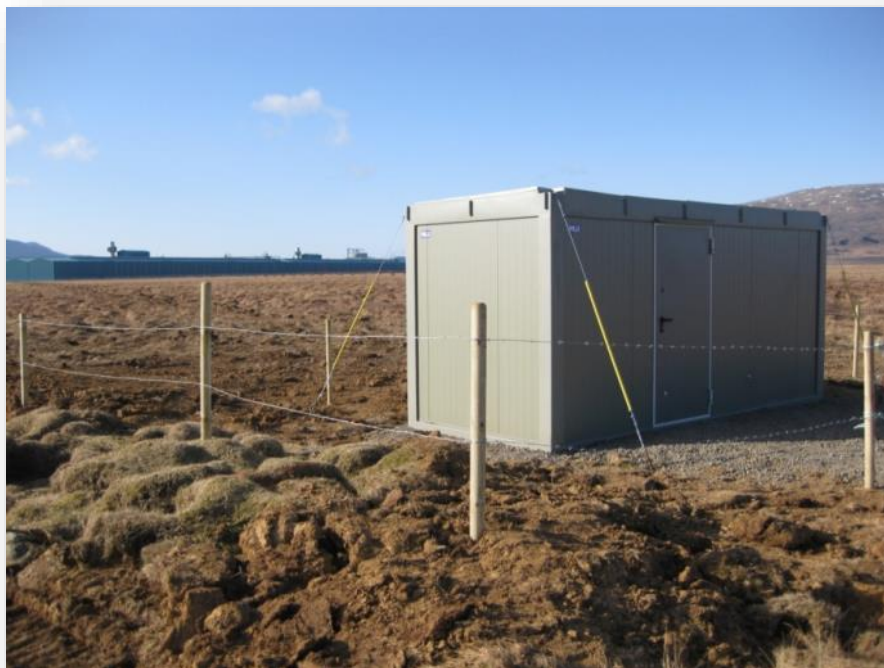
Mynd 2 Dæmi um loftgæða- og veðurmælingahús. Mælistaður við Kríuvörðu á Grundartanga.